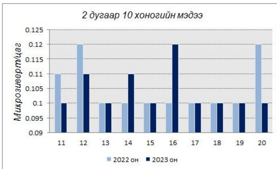
График4. Улиастай сумын агаар болон газрын гадарга дах 2 дугаар 10 хоногийн түвшний тунгийн чадлын өдрийн дундаж өмнөх онтой харьцуулсан үзүүлэлт