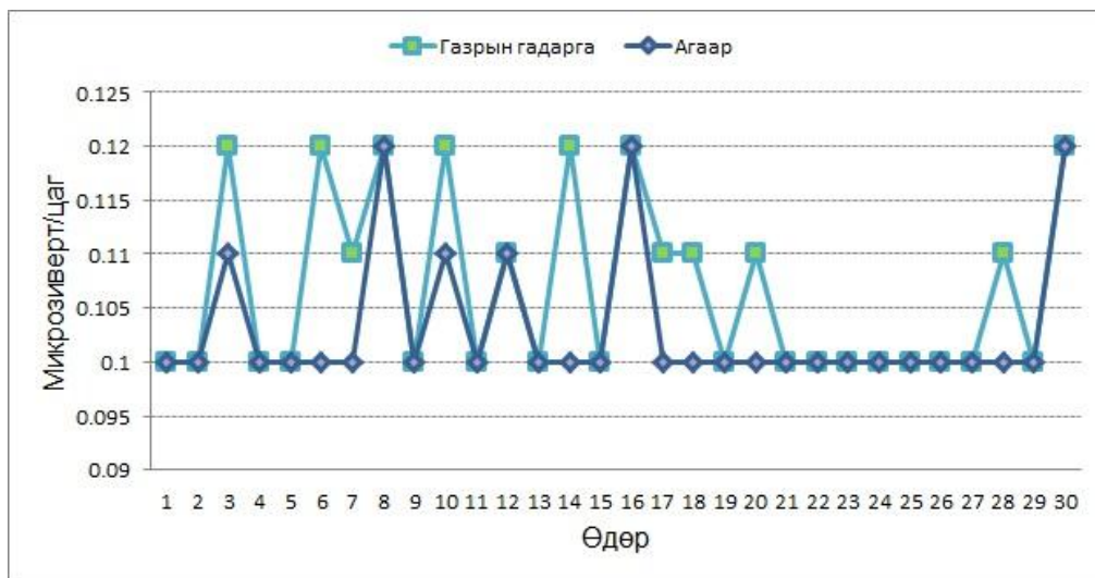
График1. Улиастай сумын агаар болон газрын гадарга дах цацрагийн түвшний тунгийн чадлын өдрийн дундаж утга

Улиастай, Баянтэс сумдын 06 сарын агаар болон газрын гадарга дах цацрагийн түвшний тунгийн чадлын өдрийн дундаж утгийг графикаар харуулав.