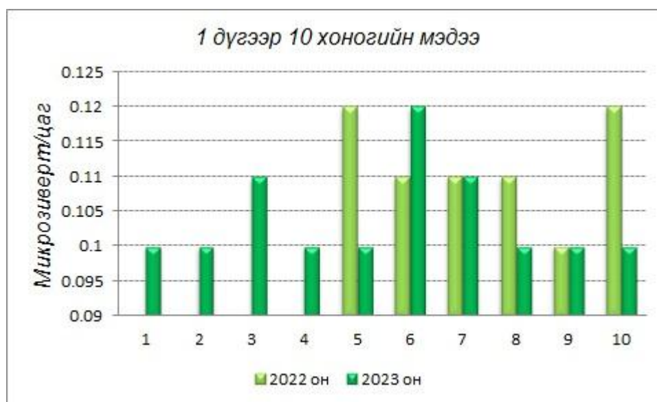
График6. Баянтэс сумын агаар болон газрын гадарга дах 1 дүгээр 10 хоногийн түвшний тунгийнчадлын өдрийн дундаж өмнөх онтой харьцуулсан үзүүлэлт

*Баянтэс сумын Баян-Уул өртөөний агаар болон газрын гадарга дах цацрагийн түвшний тунгийн чадлын өдрийн дундаж утгыг өмнөх онтой харьцуулснаар дараах графикуудаар харуулав.