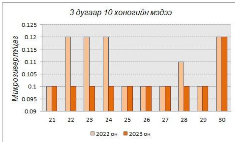
График5. Улиастай сумын агаар болон газрын гадарга дах 3 дугаар 10 хоногийн түвшний тунгийнчадлын өдрийн дундаж өмнөх онтой харьцуулсан үзүүлэлт

Хэмжилтийн дүнгээс харахад 2022 онд агаар дах цацрагийн түвшний дунджийн хамгийн их утга нь 0.14микрозиверт/цаг, хамгийн бага утга нь 0.10 микрозиверт/цаг байсан бол 2023 онд дунджийн хамгийн их утга нь 0.12микрозиверт/цаг, хамгийн бага утга нь 0.10 микрозиверт/цаг байна. Мөн 2022 онд газрын гадарга дах цацрагийн түвшний дунджийн хамгийн их утга нь 0.13 микрозиверт/цаг, хамгийн бага нь 0.10 микрозиверт/цаг байсан бол 2023 онд дунджийн хамгийн их утга нь 0.12 микрозиверт/цаг, хамгийн бага утга нь 0.10 микрозиверт/цаг байна.