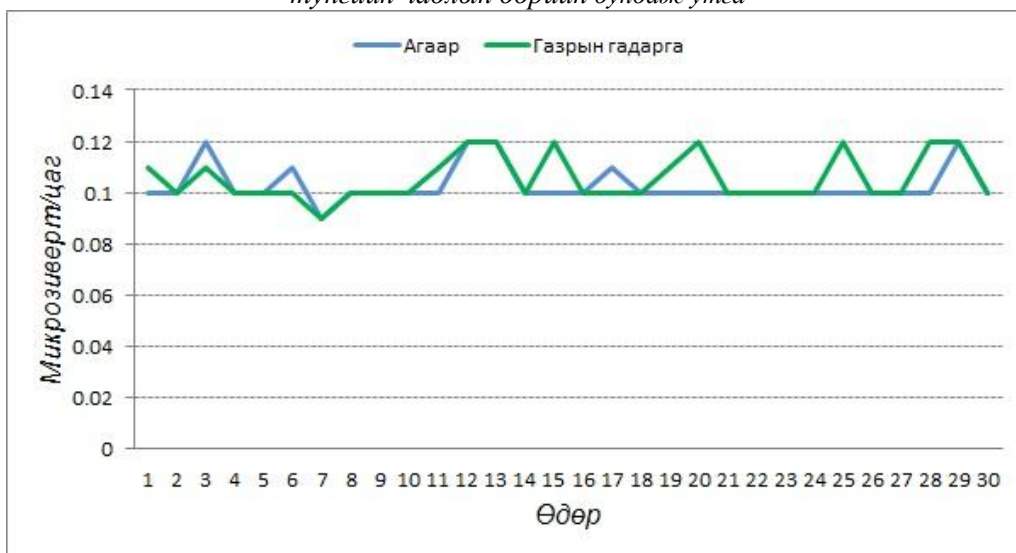
График2. Баянтэс сумын агаар болон газрын гадарга дах цацрагийн түвшний тунгийн чадлын өдрийн дундаж утга