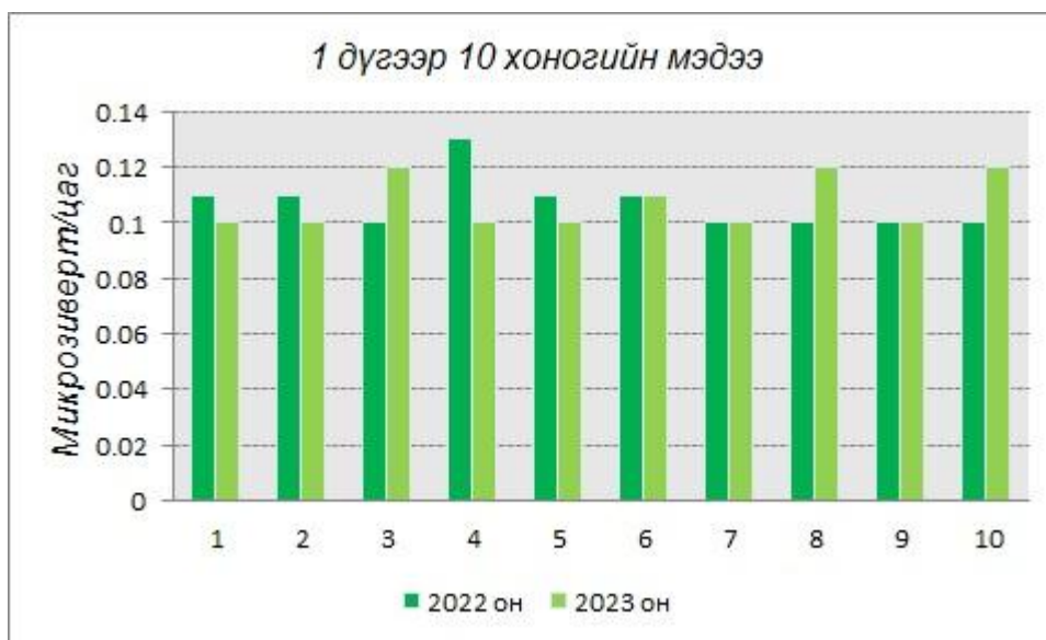
График3. Улиастай сумын агаар болон газрын гадарга дах 1 дүгээр 10 хоногийн түвшний тунгийн чадлын өдрийн дундаж өмнөх онтой харьцуулсан үзүүлэлт

*Улиастай өртөөний агаар болон газрын гадарга дах цацрагийн түвшний тунгийн чадлын өдрийн дундаж утгийг өмнөх онтой харьцуулснаар дараах графикаар харуулав.