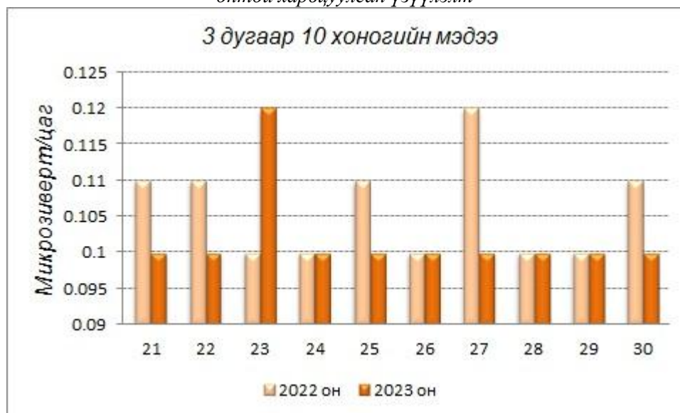
График8. Баянтэс сумын агаар болон газрын гадарга дах 3 дугаар 10 хоногийн түвшний тунгийнчадлын өдрийн дундаж өмнөх онтой харьцуулсан үзүүлэлт

Хэмжилтийн дүнгээс авч үзвэл 2022 онд агаар дах цацрагийн түвшний дунджийн хамгийн их утга нь 0.13 микрозиверт/цаг, хамгийн бага утга нь 0.09 микрозиверт/цаг байсан бол 2023 онд дунджийн хамгийн их утга нь 0.12 микрозиверт/цаг, хамгийн бага утга нь 0.10 микрозиверт/цаг байна. Мөн хэмжилтийн дүнгээс харвал 2022 онд газрын гадарга дах цацрагийн түвшний дунджийн хамгийн их утга нь 0.12 микрозиверт/цаг, хамгийн бага нь 0.10 микрозиверт/цаг байсан бол 2023 онд дунджийн хамгийн их утга нь 0.12 микрозиверт/цаг, хамгийн бага утга нь 0.10 микрозиверт/цаг байна.